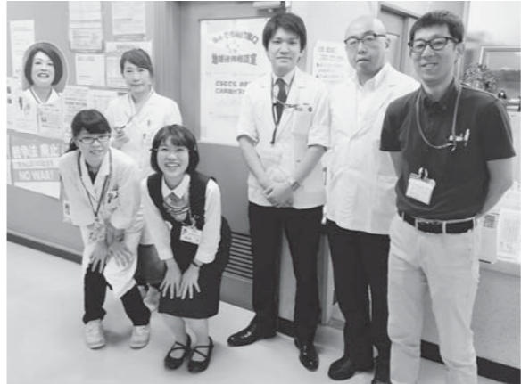
私たちがご相談にのります

連絡先はこちら [9時~17時] ●共和会地域連携ネットワークセンター(才田) ●東神戸病院何でも相談窓口(地域連携相談室) 電話 078-841-5731(代表)