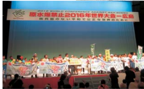
8/4 原水禁世界大会開会総会